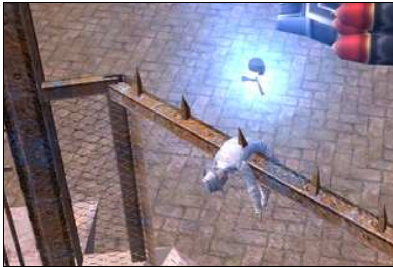
Einfach mal so rumhängen... Premutos