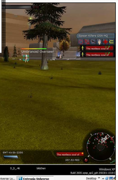
Spawn bei Hadesheim... neon